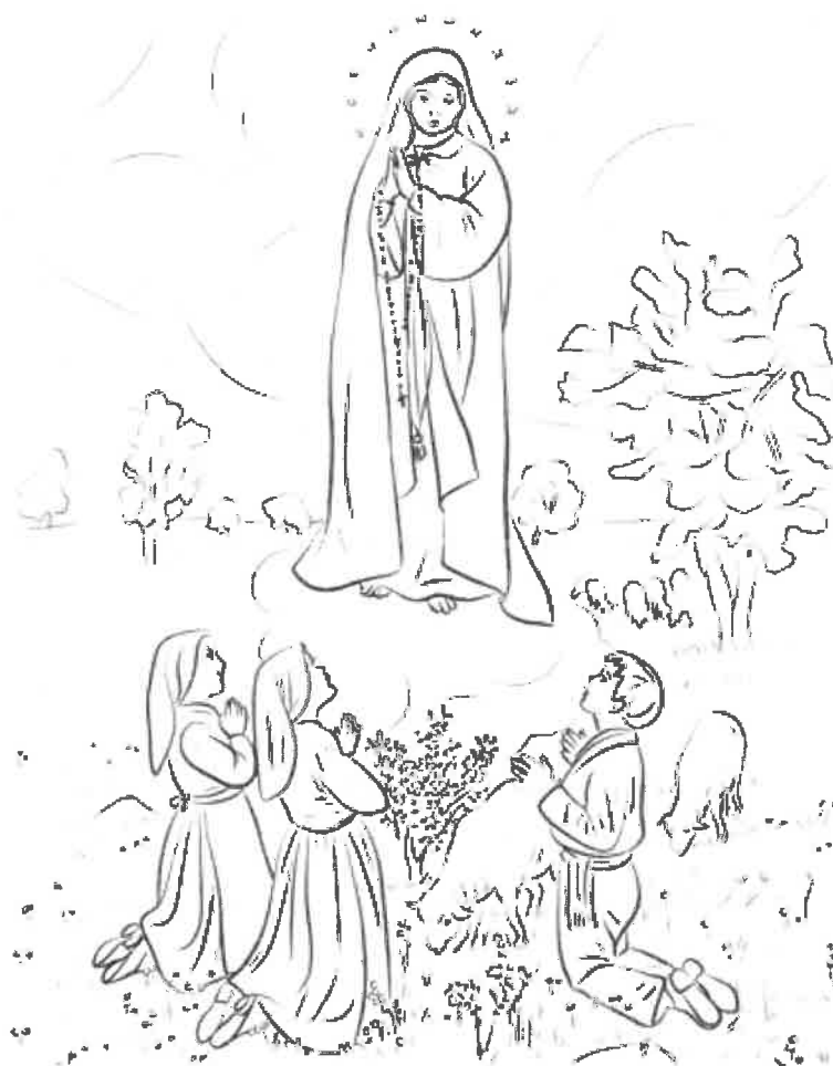
Notre-Dame de Fátima (Portugal)

Le Samedi 9 Mai 2026 la Communauté Portugaise et la Paroisse St-Joseph des Deux-Rives commémorent l'Apparition de la Vierge à Fátima.